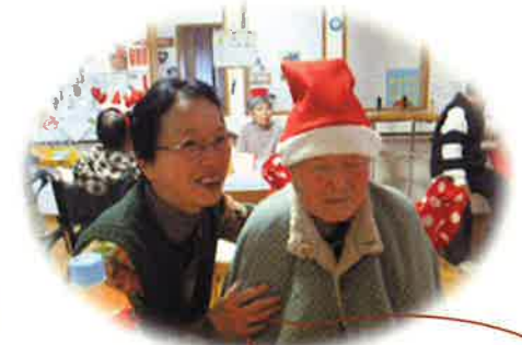
サンタさんがき ましたよー