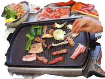
道後ユニットは、焼肉パーティー