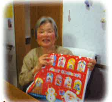
プレゼント もらったよ～