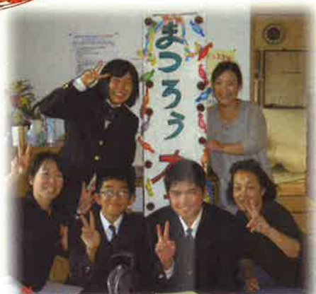
ろう学校生徒さんによるお茶会が 開かれました。