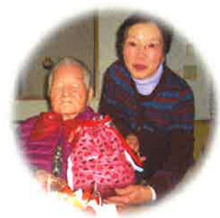
98歳の誕生日 白寿をお祝いしました。 元気に過ごせますように・・・