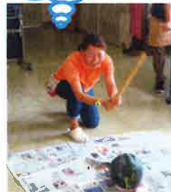
声の大きいだけで割れてません…