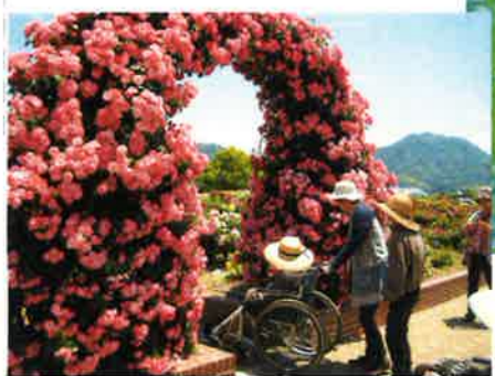
見事なアーチ！ 順番にくぐってみました。

5月に吉海バラ公園へお弁当を持って出かけました。お天気が心配でしたが、皆さんの強い願いが叶い、満開のバラを楽しむ事ができました。デイサービスでは、お弁当は調理員による「手作り弁当」を持って行き、なかにはバラよりお弁当の方が楽しみ♡と‘花より団子’の方々もおられました。行き帰りの車中でのおしゃべりも満開の花が咲き、楽しい一日でした。