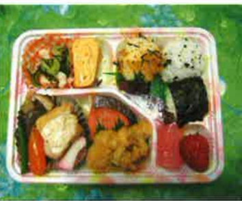
これが噂の 手作り弁当です！