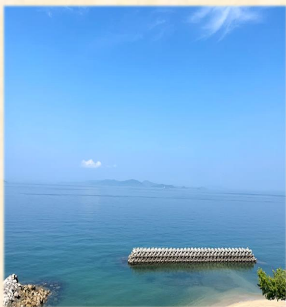
ダイニング 晴からの眺め